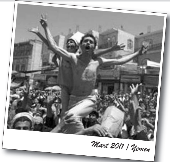
Mart 2011 | Yemen

Protesto gösterisini yapanlar ağırlıklı olarak üniversite öğrencilerinden ve üniversiteyi bitirmiş öğrencilerden oluşuyor. Öğrenciler öğrenimlerini bitirdikten sonra iş bulamadıklarını söylüyorlar ve geleceklelerinden endişe duyuyorlar ve “artık yeter” diyorlar.